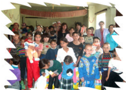
1 Iunie - Mures