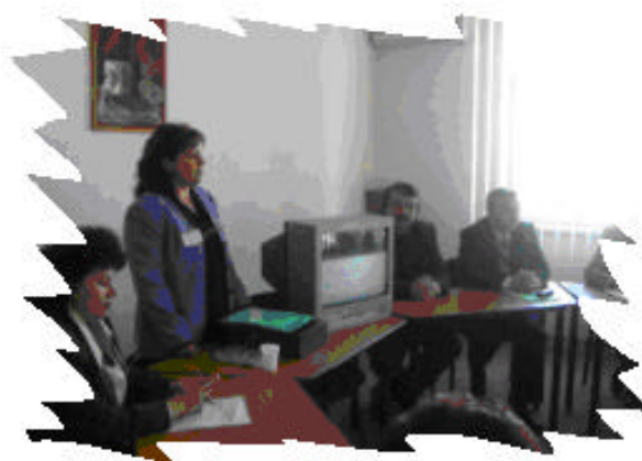
Constanta – Ialomita