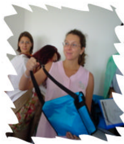
Bun venit bebelusule