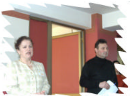
Lansarea campaniei 1% la Constanta

Activitatile proiectului s-au desfasurat in judetele Constanta, Iasi si Mures. Prin intermediul campaniei de informare, publicul larg a putut fi informat corect despre realizarile deosebite ale fundatiei Holt Romania si despre dreptul legal de a sustine activitatea unei entitati non profit prin redirectionarea unei cote din impozitul datorat statului.