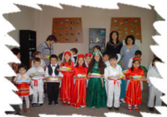
1 Iunie - Medgidia