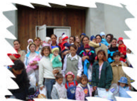
1 Iunie - Iasi