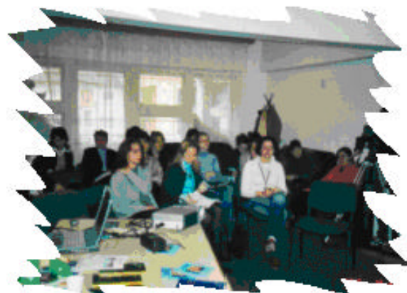
Mures - Bistrita