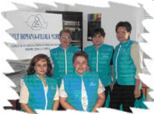
Campania 1% la Mures