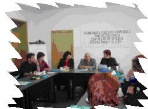
Constanta – Prahova