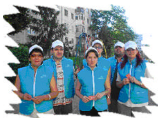
Campania 1% la Iasi