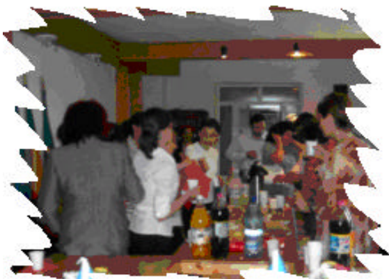
1 Iunie – Cumpana

☞ 190 copii si 161 parinti au participat la 8 Evenimente Speciale organizate cu ocazia zilei de 8 Martie, a Sarbatorilor de Paste, a Zilei Internationale a Copilului, Inceperea anului scolar si a Craciunului;