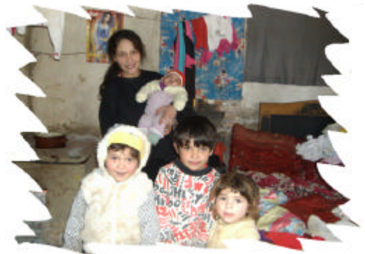
Copii si familii cu care organizatia Holt Romania lucreaza