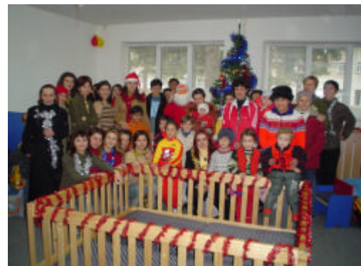
Serbare de Craciun - Iasi