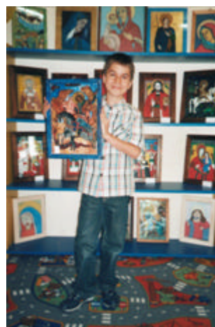
27 mai 2004 Mures - Expozitie de icoane pe sticla cu vanzare