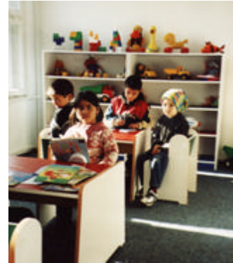
Camera de joaca pentru copii

≈ 236 parinti au participat la Intalniri cu diversi Specialisti , fiind impactati un numar de 564 copii .