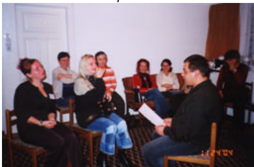
Imagini din timpul derularii sesiunii de instruire 23-26 noiembrie