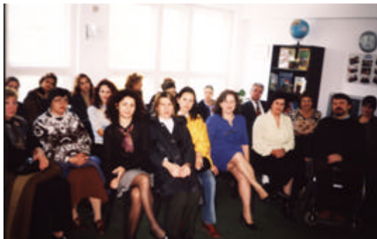
Conferinta UNICEF octombrie 2003

≈ Au fost pregatiti teoretic si practic 40 de reprezentanti ai autoritatilor locale implicate in Protectia copilului din judetele Braila, Salaj, Giurgiu si Suceava.