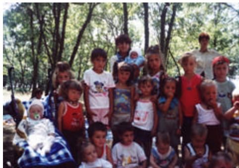
1 Iunie, Ziua Internationala a Copilului

≈ 137 copii si 92 familii au participat la Evenimentele Speciale organizate cu ocazia zilei de 8 Martie, a Sarbatorilor de Paste, a Zilei Internationale a Copilului si a Craciunului;