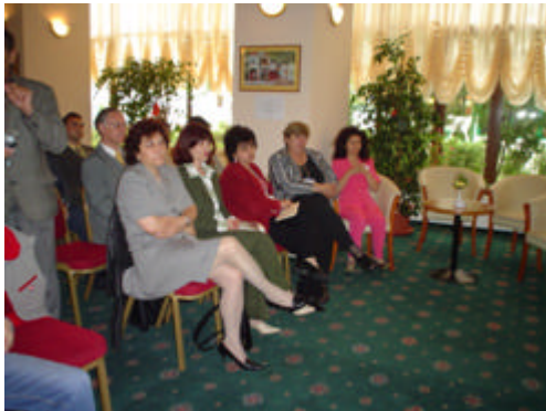
30 mai 2004 – Hotel Savoy, Mamaia