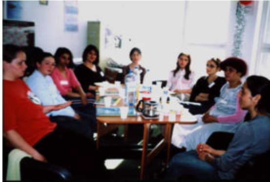
Cursuri "Cum sa devenim parinti mai buni"