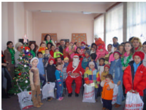
Serbare de Craciun - Medgidia