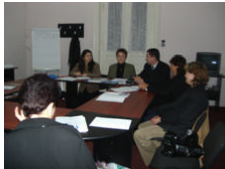
Intalnirea cu Specialistul

≈ 236 parinti au participat la Intalniri cu diversi Specialisti , fiind impactati un numar de 564 copii .