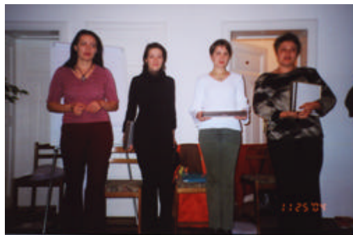
Echipa de trainerii