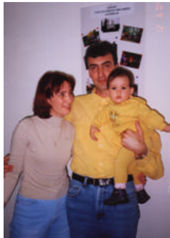
Familii adoptive si copii adoptati