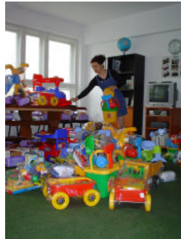
Jucarii 1 iunie 2004