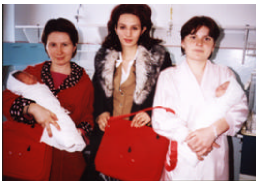
Bun venit bebelusule

≈ 1602 copii si 1551 mame au beneficiat de componenta Bun venit bebelusule in maternitatile din Medgidia, Iasi, Constanta, Targu Mures si Bucuresti. Mamele care au nascut au primit vizita unui specialist Holt cu care au avut o prima discutie despre rolul provocator de parinte si au primit un cadou.