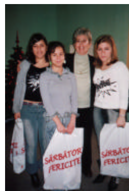
Craciunul 2004 impreuna cu grupurile de frati din programul Lift